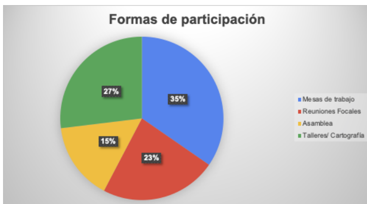
Gráfica 2. Cuestionario sobre medios de comunicación para la difusión de información durante emergencia por Covid-19. Páramo de Sumapaz: Municipios (25). Resultado de espacios de diálogo virtuales con alcaldías y personerías municipales entre agosto- septiembre de 2020

Como se pudo ver en la gráfica anterior, el 35% de los municipios considera los espacios de mesas de trabajo como ideales para fomentar la participación de sus comunidades una vez sea superada la emergencia sanitaria; el 27% sugiere la realización de talleres o ejercicios para evidenciar condiciones de localización del páramo, el 25% recomienda realizar reuniones focales a nivel municipal y el 15% solicitan espacios masivos y asamblearios.