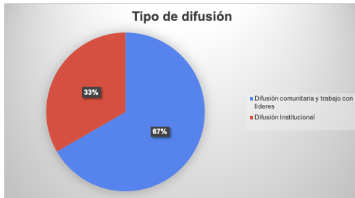
Gráfica 3. Cuestionario sobre medios de comunicación para la difusión de información durante emergencia por Covid-19. Páramo de Sumapaz: Municipios (25). Resultado de espacios de diálogo virtuales con alcaldías y personerías municipales entre agosto- septiembre de 2020