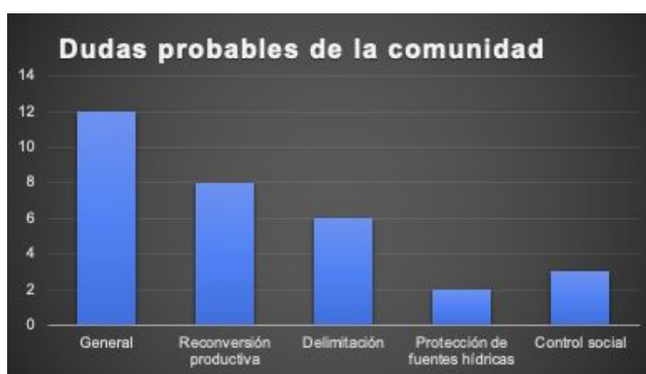
Gráfica 5. Cuestionario sobre medios de comunicación para la difusión de información durante emergencia por Covid-19. Páramo de Sumapaz: Municipios (25). Resultado de espacios de diálogo virtuales con alcaldías y personerías municipales entre agosto- septiembre de 2020

Debido a que las personas invitadas a los espacios, en la mayoría de casos son escogidos por elección popular, quienes representan y mejor conocen sus comunidades, dieron algunos avances relacionados con las posibles dudas que tienen las comunidades respecto al proceso. Entre ellas, incertidumbre o desconocimiento respecto al proceso de delimitación participativa (graficada como General). En ese sentido el Minambiente se encuentra diseñando una estrategia que permita fortalecer el conocimiento de este proceso con enfoque territorial.