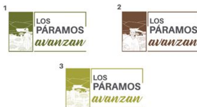
Figura 1. Piezas comunicativas, Los Páramos Avanzan.

https://www.minambiente.gov.co/index.php/bosques-biodiversidad-y-servicios-ecosistematicos/paramos/delimitacion-participativa-paramo-cruz-verde-sumapaz