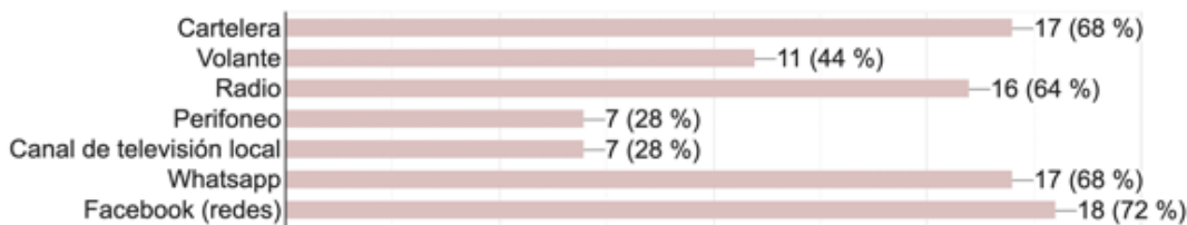
Gráfica 1. Cuestionario sobre medios de comunicación para la difusión de información durante emergencia por Covid-19. Páramo de Sumapaz Municipios (25). Resultado de espacios de diálogo virtuales con alcaldías y personerías municipales entre agosto- septiembre de 2020

Los municipios sugirieron las estrategias de participación más eficaces que podrían ser empleadas en sus territorios, siendo la cartelera y las redes sociales el principal medio de difusión, seguida por la radio y los volantes.